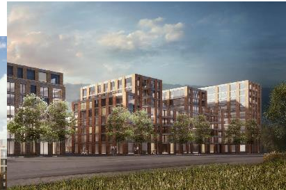
Städtisch urbane Strukturen Mehrgenerationenhäuser