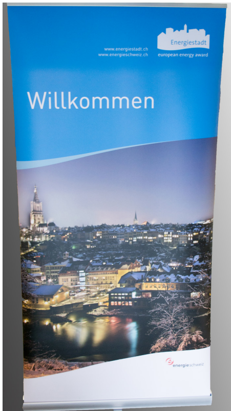
Grösse: 1000x2000mm Sujet: „Willkommen“

Das Label Energienstadt ist ein Leistungsausweis für Gemeinden, die eine nachhaltige kommunale Energiepolitik vorleben und umsetzen. Energienstädte fördern erneuerbare Energien, umweltverträgliche Mobilität und setzen auf eine effiziente Nutzung der Ressourcen.