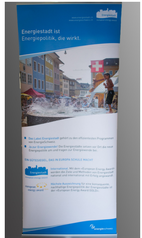
Grösse: 850x2000mm Sujet: „Energienstadt ist Energiepolitik, die wirkt“